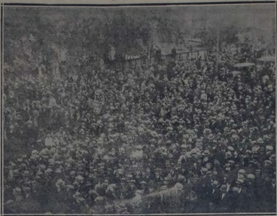
UN ASPECTO DE LA ENORME CONCURRENCIA QUE PRESENCIABA LA BUSQUEDA DE LOS CADAVERES

Mañana lunes, a las 18 horas, se reúnen los miembros del Comité Ejecutivo Nacional del Partido, a objeto de considerar el orden del día que se les ha distribuido por circular.