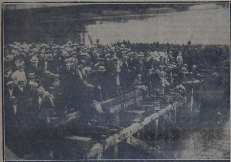
OTRO ASPECTO DEL PUBLICO QUE SEGUIA LOS EMPEROSOS ESFUERZOS DE LOS BUZOS