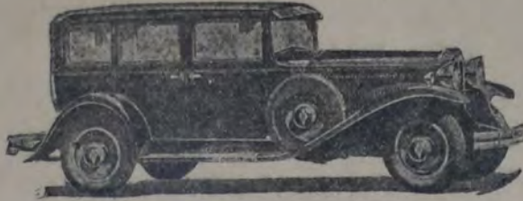
SEDAN 8 — MODEL “C”

de aceleración funciona perfectamente y la facilidad para subir cuestas es asombroso. El cansancio en el manejo del coche es incomprensible, ya que la conducción no requiere esfuerzo, aún a gran velocidad. Otras ventajas en viajes largos, son la comodidad y el dominio completo sobre todo el organismo del motor. Para especializar la producción de